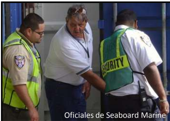
Oficiales de Seaboard Marine