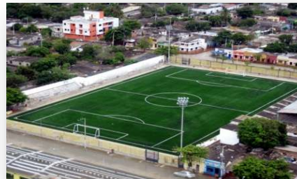
REMODELACIÓN CANCHA LA CASTELLANA