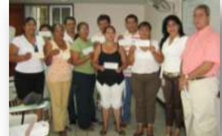
PROGRAMA DE MICROCRÉDITO