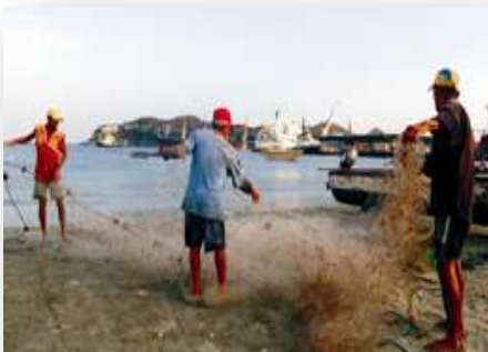
PESCADORES EN LA HABÍA