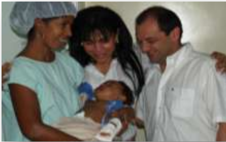
PROGRAMA OEPERACIÓN SONRISA