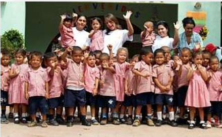
PROGRAMAS PRIMERA INFANCIA