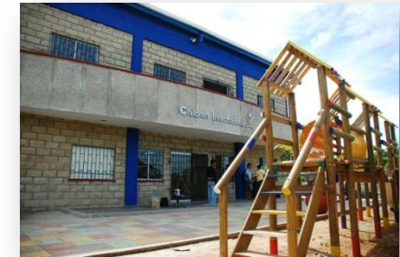
PROGRAMA CHILDREN INTERNATIONAL